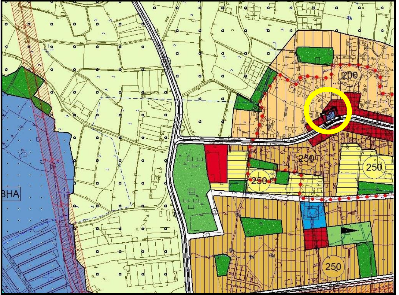
Tablo 1:Arazi Kullanım Tablosu